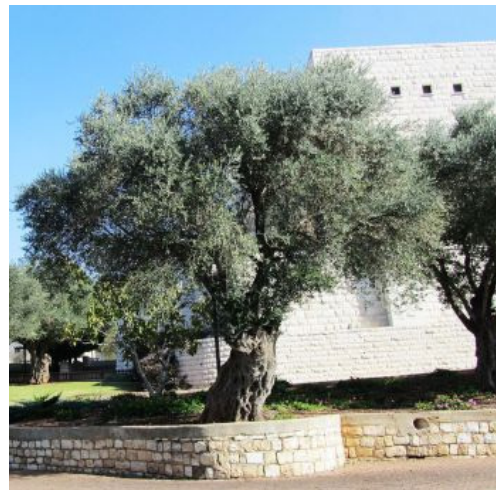
הטוב צומח ועולה ונהפך לאילן ענק. עץ זית עתיק בצפת

לעיתים נדמה לנו שרק מהפכות גדולות יכולות לשנות את המציאות. ט"ו בשבט, ראש השנה