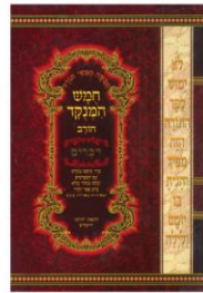
פרשה - עמ' 627 הפטרה - עמ' 673