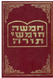
פרשה - עמ' 158 הפטרה - עמ' 169