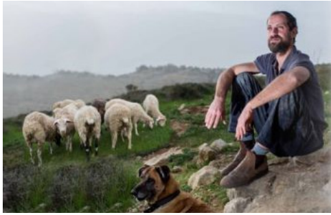
מתמודד עם טרור והצקות. שבתי במרעה

שבתי מסביר את משמעותה של רעיית הצאן: "המרעה מאפשר לך לשלוט על שטח גדול ולקבוע גבולות. בתחילה היו חיכוכים ומריבות עם ערבים, וברוך השם זה מאחורינו".