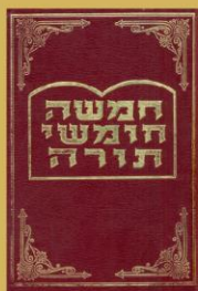
פרשה - עמי 483 הפטרה - עמי 492