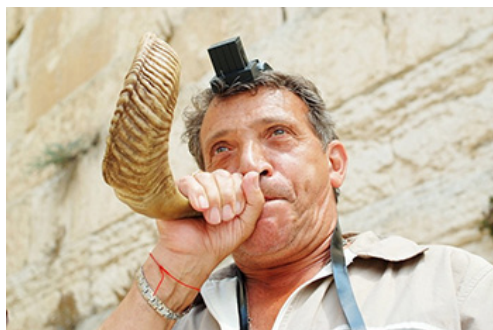
קריאה לחשבון נפש ולהתעוררות

משימה חשובה זו איננו עושים לבדנו. בחודש אלול הקב"ה מתקרב אלינו יותר מכל ימות השנה. הוא נמשל למלך שיוצא אל השדה, אל העם. אין צורך לעבור מחסומים, פקידים וראשי לשכות. כל הרוצה יכול לגשת אל המלך, להתקרב אליו, לשאוב כוחות ולבקש את משאלות ליבו. הקב"ה קרוב עכשיו לכל יהודי. קל יותר לקבל החלטות טובות, קל יותר להשתפר ולהשתנות.