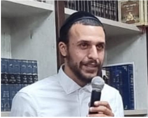
"רגעים שבהם זכיתי להתקשר עם בורא העולם". ברק.

מהנס הבלתי-ייאמן שחוויתי, היא הפרופורצייה. צריך להגיד תודה על כל דבר שקיבלנו בחיים. התחנת כדת משה וישראל? תודה להשם. יש לך ילדים? תודה להשם. יש לך מה לאכול בבוקר? תודה להשם. שום דבר אינו מובן מאליו. כל רגע שאנחנו חיים - זו הודיה להשם.