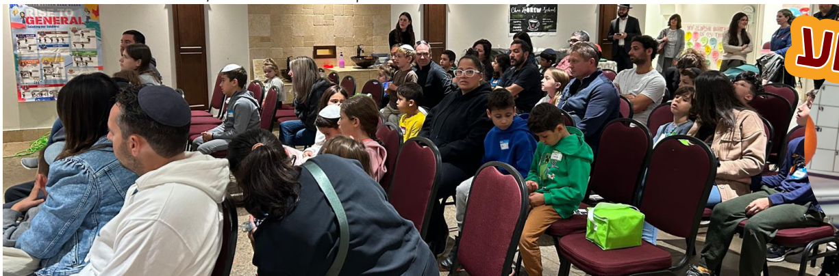
עשרות הורים נרגשים השתתפו בשבוע שעבר באוריינטיישן של מסגרת "היברו סקול" במרכז חב"ד לדוברי עברית

מתברר כי בימי קדם השופר שימש גם כאות קריאה לעם להתכנס. בתנ"ך מובאים מקרים שונים בהם המצביאים השתמשו בשופר כדי לכנס את החיילים ולצאת למלחמה, ובמקרה מעניין אחד השתמש מצביא בשם גדעון בשלוש מאות שופרות כדי לזרוע מבוכה במחנה האויב - טקטיקה שהצליחה. השופר גם שימש להכרזה על משיחת מלך חדש למלך על ישראל.