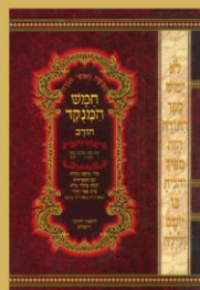
פרשה - עמי 1967 הפטרה - עמי 2002